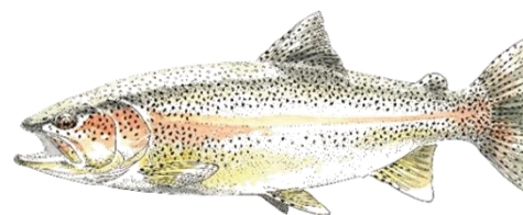
Truite arc-en-ciel (TAC)